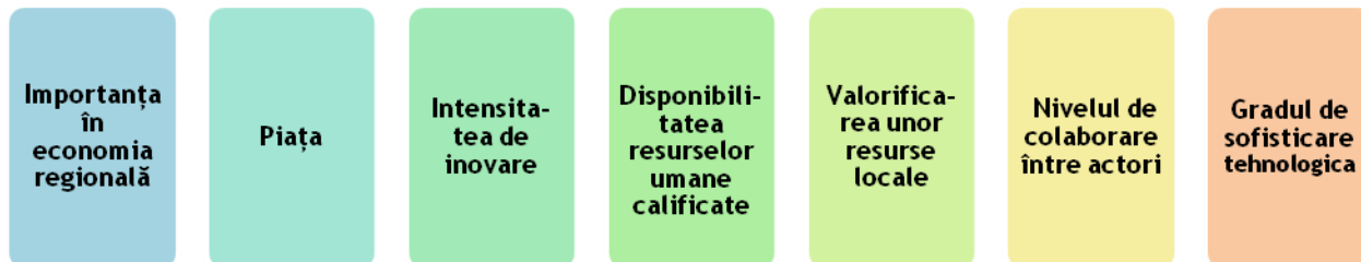
Figura 1. Criterii folosite pentru analiza domeniilor selectate

Pentru fiecare dintre aceste criterii s-a dezvoltat o serie de argumente care să permită o evaluare a domeniului bazată pe evidențe. Astfel, aceste argumente fac referire atât la informații statistice (cum ar fi numărul de firme, cifra lor de afaceri, valoarea exporturilor), performanțe punctuale (precum investiții majore, inovații sau produse de top), tendințe internaționale relevante (dinamica de piață europeană sau globală, noi valuri tehnologice), cât și la opinii exprimate de reprezentanți ai mediului de afaceri privind dinamica ecosistemului regional aferent domeniului.