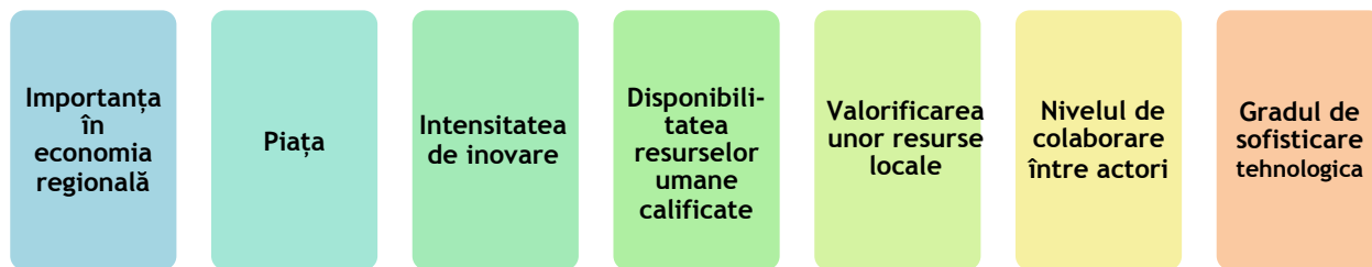
Figura 1. Criterii folosite pentru analiza domeniilor selectate

Pentru fiecare dintre aceste criterii s-a dezvoltat o serie de argumente care să permită o evaluare a domeniului bazată pe evidențe. Astfel, aceste argumente fac referire atât la informații statistice (cum ar fi numărul de firme, cifra lor de afaceri, valoarea exporturilor), performanțe punctuale (precum investiții majore, inovații sau produse de top), tendințe internaționale relevante (dinamică de piață europeană sau globală, noi valori tehnologice), cât și la opinii exprimate de reprezentanți ai mediului de afaceri privind dinamica ecosistemului regional aferent domeniului.